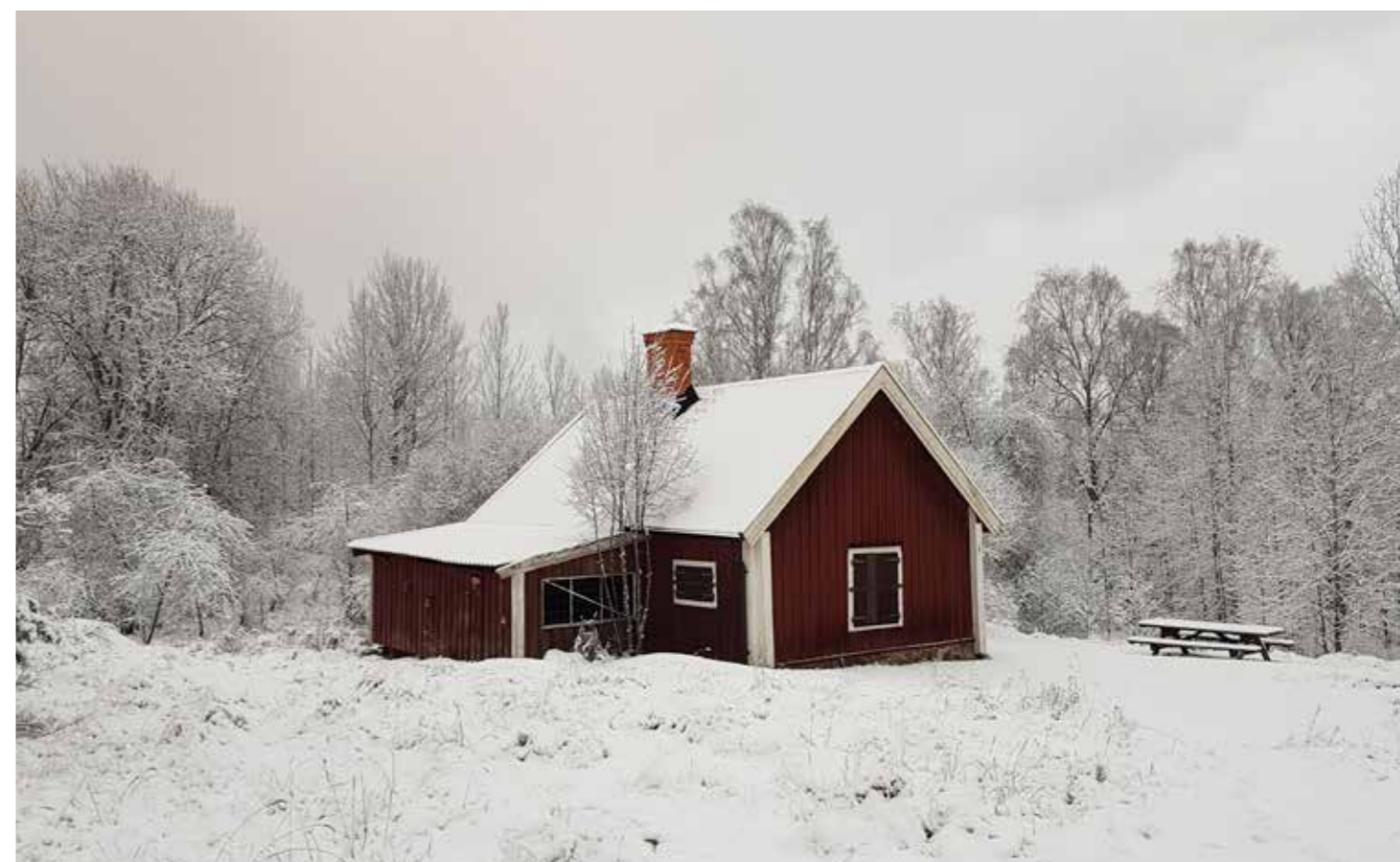
Fig. 6. Ekonomibygnad.