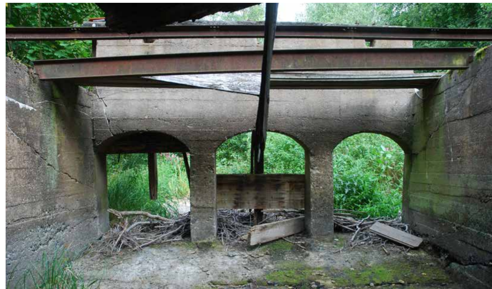
Fig. 7. Karlösa kvarn, Norrtälje.

kommer att påverka skogen. Särskilt värdefulla områden ska skyddas mot ingrepp och andra störningar. Läs mer: http://www.sverigemiljomal.se/miljomalen/