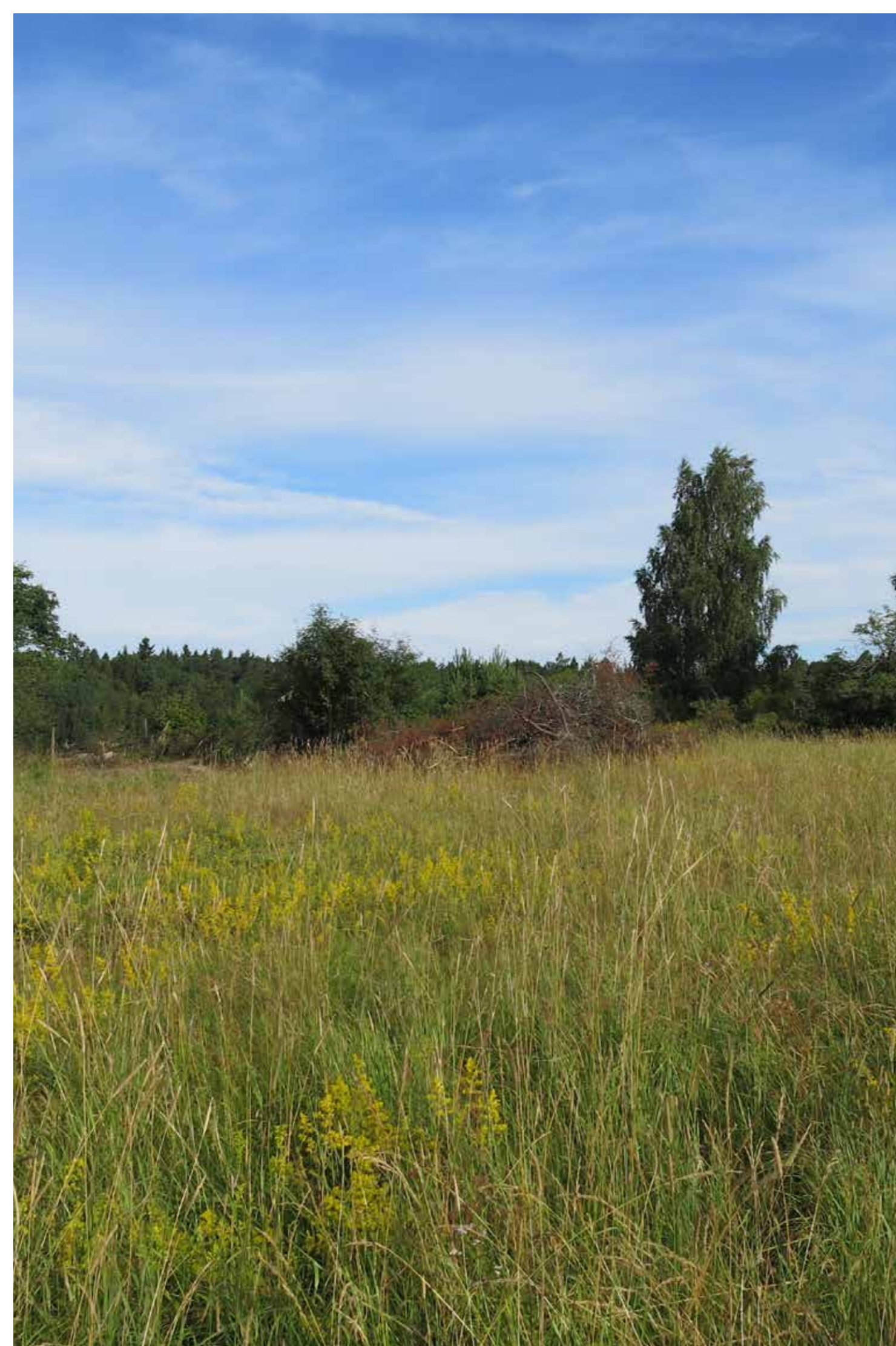
Fig. 9. Arkeologisk undersökning. Arninge, Täby kommun.