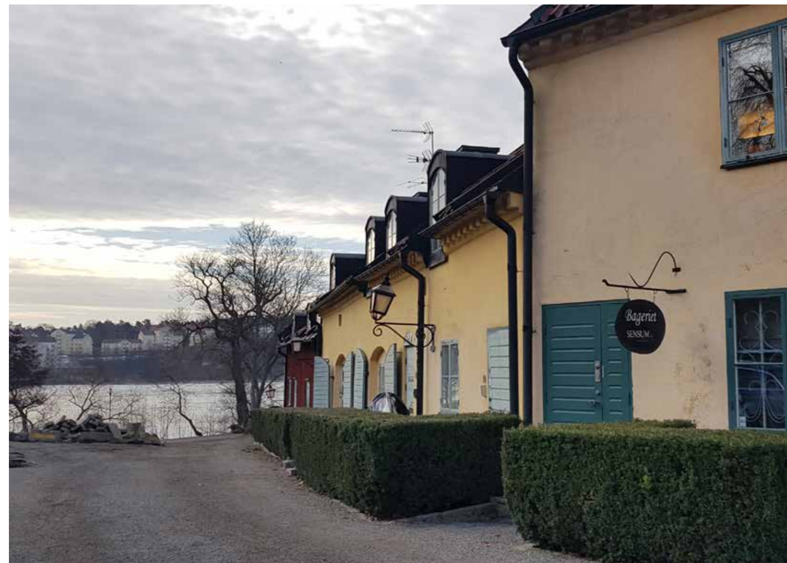
Fig. 1. Solna.