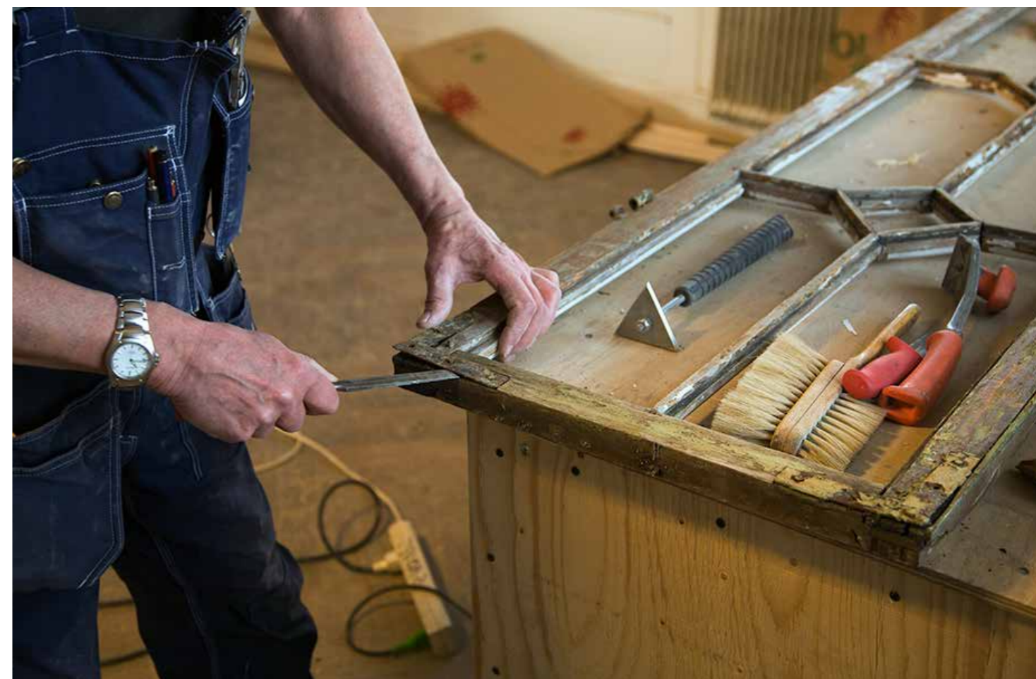
Fig. 12. Fönsterrenovering.

Litteratur: RAÄ – Fem pelare vägledning till god byggnadsvård finns att ladda ner på RAÄ:s hemsida. http://samla.se/xmlui/handle/raa/277