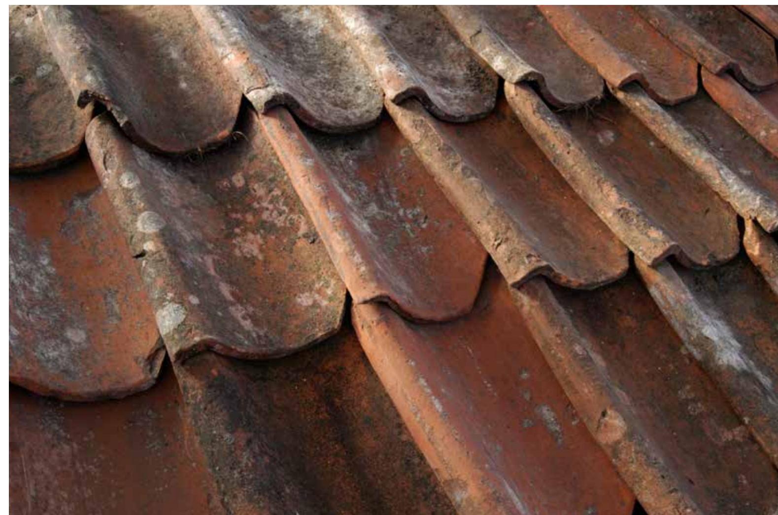
Fig. 11. Enkelkupigt taktegel, Åsöberget.